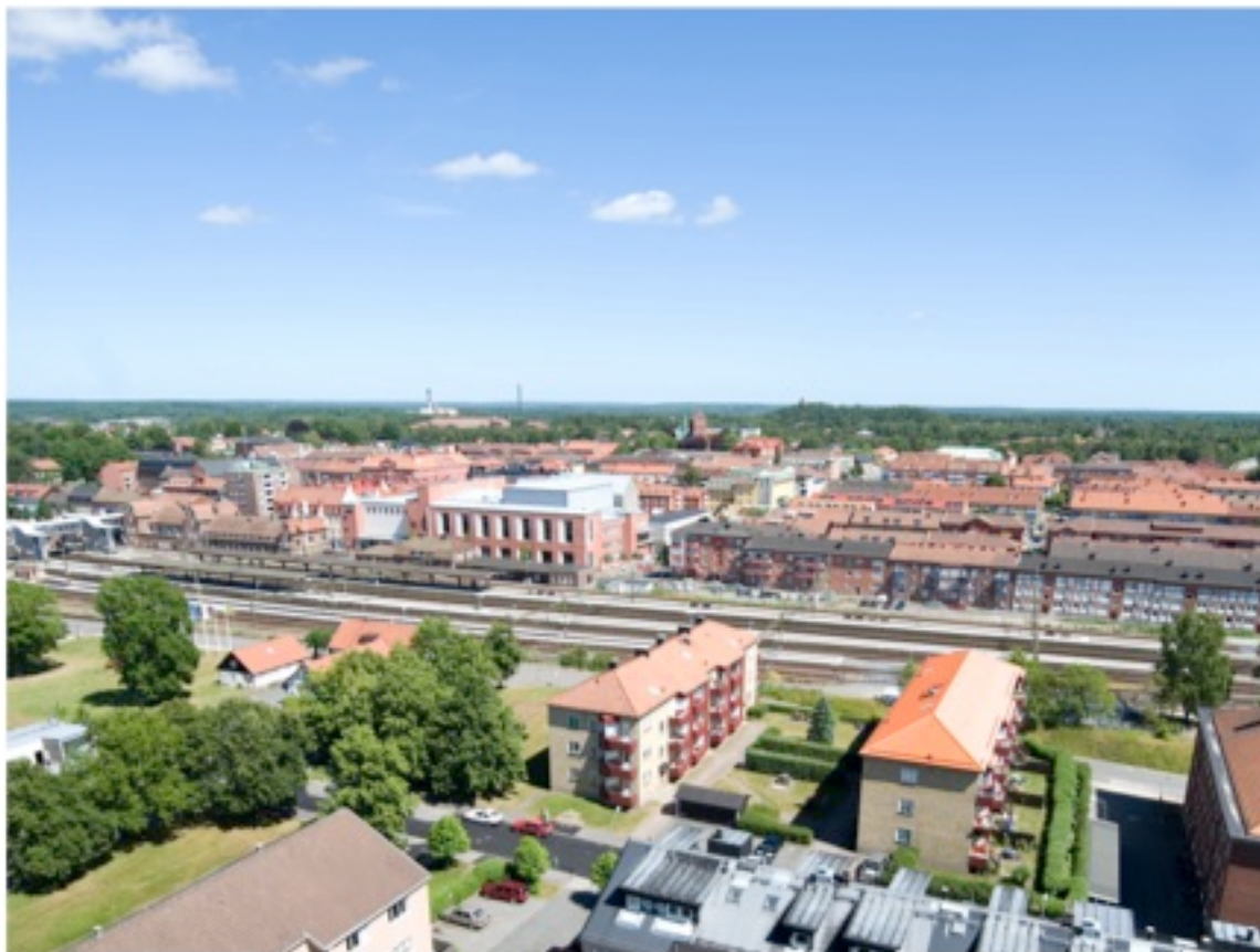
Utsikt över staden från våning 15.